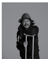
Stylist : Masahiro Hiramatsu